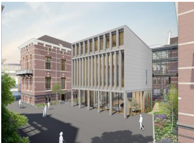
Artist impressie ontwerp BG5 zoals gepresenteerd bij de CRK op 4 oktober 2023

De commissie heeft een negatief advies gegeven op het ontwerp en geadviseerd om (onder andere) goed te kijken naar de ruimte tussen het monument en het paviljoen en de aansluiting van het atrium en het paviljoen op de openbare ruimte. Het hele advies is te lezen in het verslag van de CRK 4 oktober 2023 .