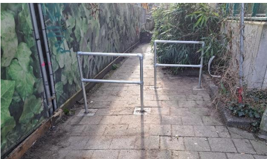
Foto: de nieuwe hekjes in de Binnengasthuisstraat

In de Binnengasthuisstraat zijn vorige week in overleg met buurtbewoners door de gemeente hekjes geplaatst om de overlast van fietsers in de straat te voorkomen.