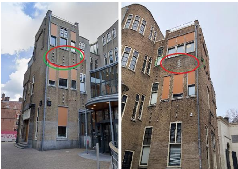
Figuur: Foto locatie werkzaamheden

Hieronder is een foto van de locatie van de werkzaamheden en planning.