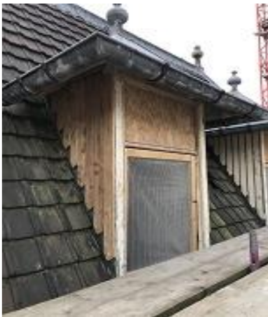
Foto: Noodramen Zusterhuis

Binnen het Zusterhuis is er gestart met het slopen van metselwerk, waarna vervolgens stalen spanten worden ingebracht. Het spant heeft in de bouwkunde als functie het dragen van de dakconstructie, inclusief de daarop uitgeoefende belasting van dakbedekking, sneeuw, wind en dergelijke. De ramen en deuren worden verwijderd en elders gerestaureerd waarna deze vervolgens terug op de bouw komen. Op de bouwplaats worden alle gevelkozijnen, dakkapellen en boeiboorden bewerkt en afgewerkt. De ramen en deuren worden tijdens het herstel voorzien van noodramen. Op het dak van het Zusterhuis zijn ook de eerste werkzaamheden gestart. Onder andere is het grind verwijderd om de status van het dak te kunnen bepalen.