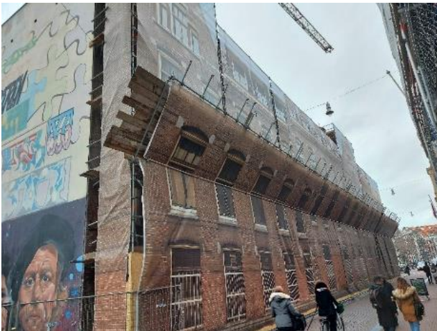
Foto: Steigerdoek aan de Nieuwe Doelenstraat

Recent is de steiger aan de Nieuwe Doelenstraat opgebouwd en in gebruik genomen. Deze gevel is gereinigd, waarna de aannemer het metselwerk en voegwerk gaat herstellen. Om de overlast in de vorm van geluid, stof en transport zoveel mogelijk te verminderen is een speciaal steigerdoek toegepast dat 80% van het vrijkomende stof tegenhoudt. Daarnaast wordt het puin opgevangen en reduceert dit doek het geluid.