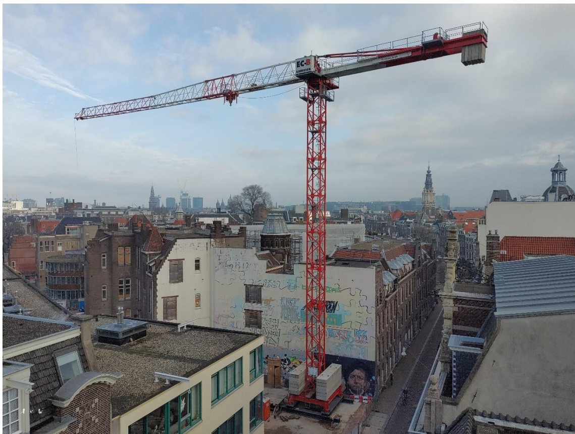
Figuur 1 De torenkraan op de hoek aan de Vendelstraat

Zoals u vast gemerkt heeft, staat de torenkraan op zijn plek. De kraan is op maandag 24 januari jl. gestart met draaien voor de aanvoer van het steigermateriaal en de opbouw daarvan in de Nieuwe Doelenstraat. Het draaien van de kraan zal u waarschijnlijk wel opvallen, maar de geluidsoverlast is zeer beperkt.