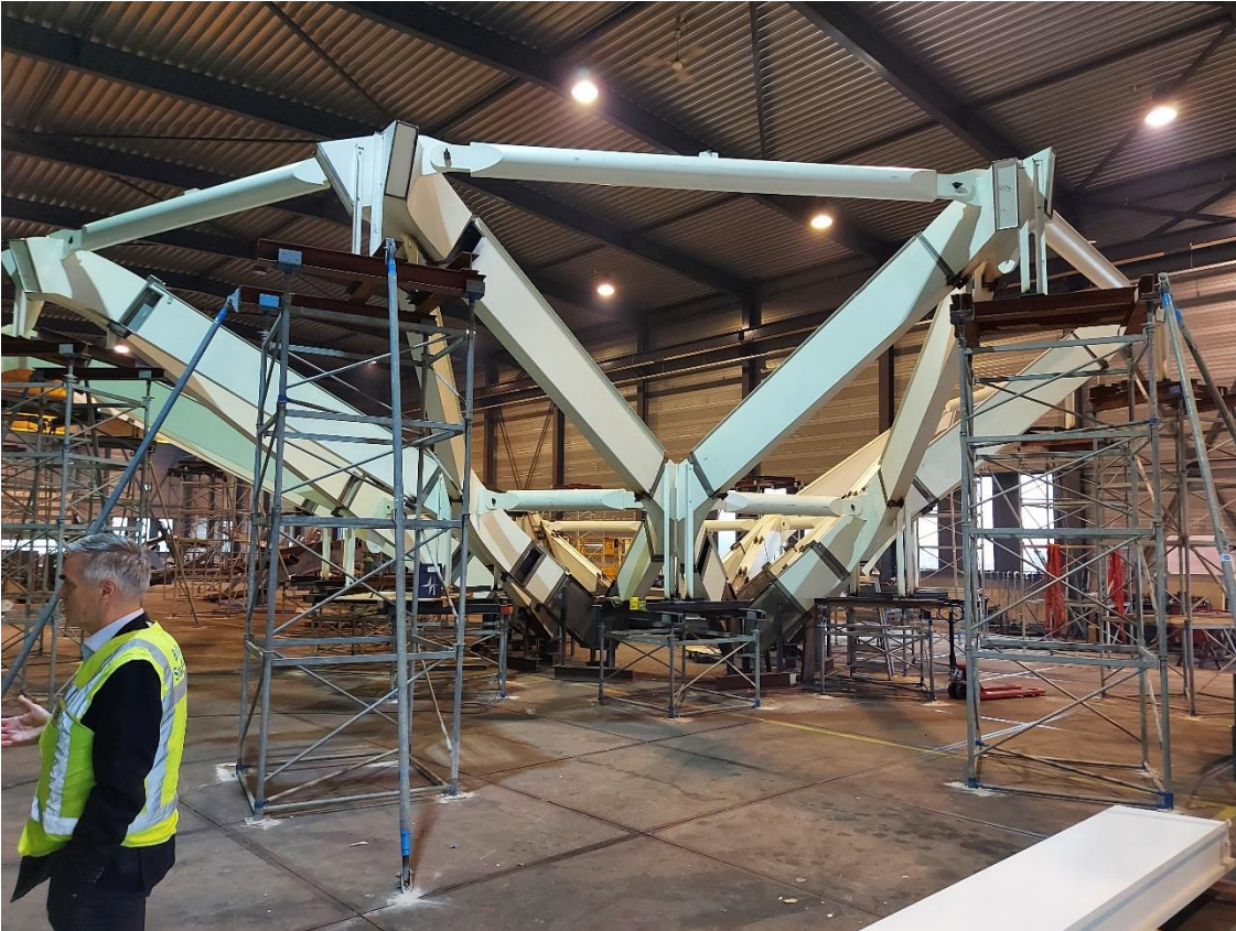
Figuur 4 De fabriek van Buiting Staalbouw in Almelo waar de boom van de atriumkap is geproduceerd.

De boom van de atriumkap is met zijn twaalf kolommen een bijzonder architectonisch element in het atrium dat de glaskap mede ondersteunt. De boom en de atriumkap zijn constructief een heel uitdagend en complex project. In deze 'boom' zit een trap zodat je via de boom ook naar de verdiepingen kunt lopen, maar ook naar de ruime bordessen met werk- en studieplekken. Daarnaast vindt de afvoer van hemelwater via figuurlijke 'lianen' in de atriumboom plaats.