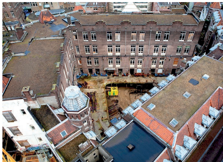
Het Klik! Fotografie

Vakblad IP volgt de wording van de Universiteitsbibliotheek van de Universiteit van Amsterdam. Eens per kwartaal zal er een thema rondom de bouw van deze nieuwe te ontwikkelen UB worden belicht. In dit nummer: de aftrap.