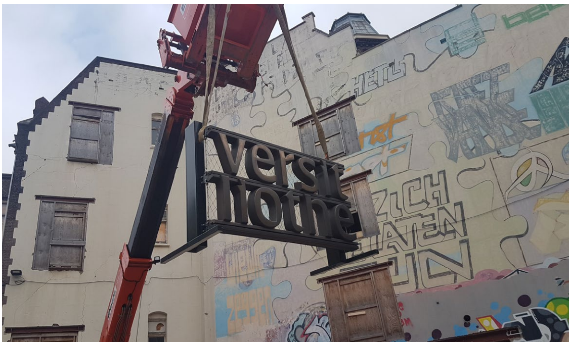
Figuur 1: Mock-up van het gevelschem.

De nieuwe UB van de Universiteit van Amsterdam (UvA) komt in 2023 in de gerenoveerde en verbouwde voormalige Tweede Chirurgische Kliniek en het Zusterhuis. Deze twee gebouwen op het Binnengasthuisterrein worden aan elkaar gekoppeld met een nieuwbouwvleugel, op de hoek van de Nieuwe Doelenstraat en de Binnengasthuisstraat. Rondom deze nieuwbouw komt een bronskleurig gevelschem. Een omvangrijk project wat betreft ontwerp, uitvoering en productie. Door de samenwerking tussen de verschillende partijen is het gevelschem een waar architectonisch en grafisch hoogstandje waar veel positieve reacties op gegeven zijn. De mock-up van het schem is te zien op de foto.