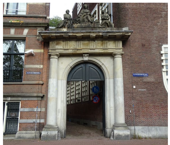
Figuur 3: De poort van de Boekensteeg bij de Oudemanhuispoort.

Vervolgens is een steiger met kap opgebouwd. Vanaf dat moment konden de beeldwerken aan de bovenzijde beter van dichtbij onderzocht worden (zie afbeelding). In eerste instantie was de verwachting dat de beelden tijdelijk verwijderd moesten worden, maar na het onderzoek bleek dat dit niet nodig was.