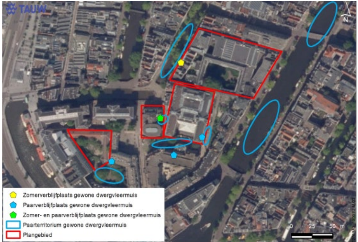
Figuur 4: Resultaten aanwezigheid van verblijfplaatsen van vleermuizen.

In onderstaande afbeelding zijn als voorbeeld de resultaten voor de dwergvleermuis gegeven: