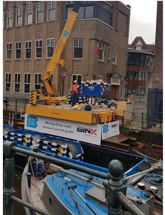
Figuur 2: BINX gebruikt deze kraanplatform in de Grimburgwal om de bouwmaterialen uit de ruimschuit met een kraan te lossen op een elektrische platte wagen op de kade.