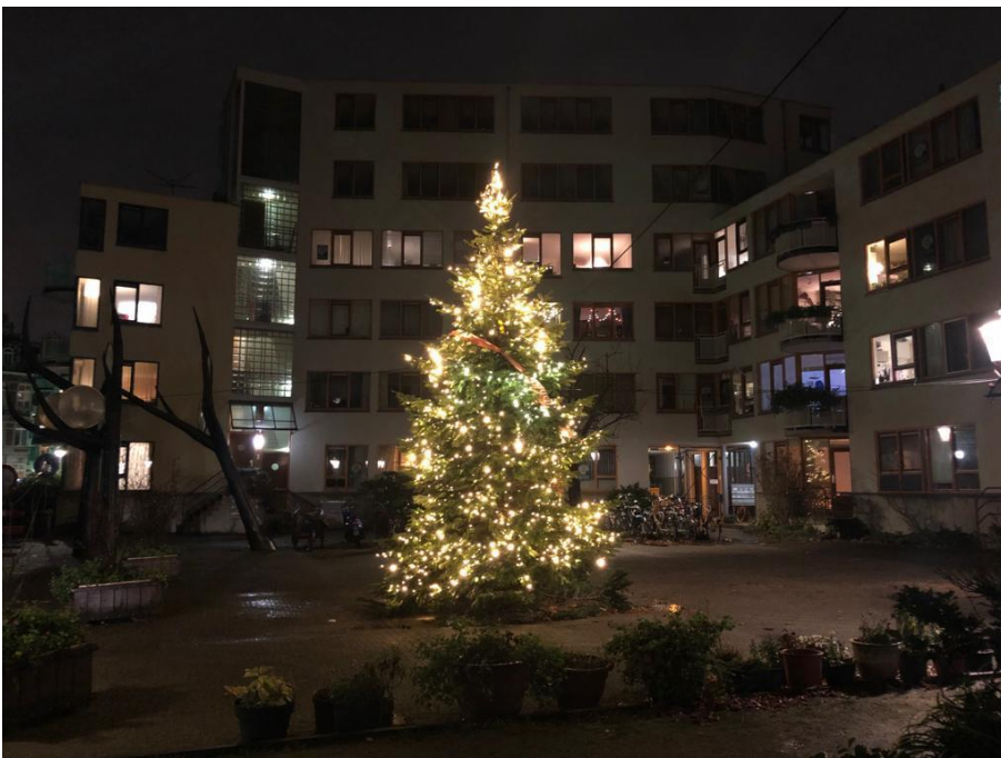
Foto: Namens de Gemeente Amsterdam, UvA en BINX is er een Kerstboom geplaatst op het Binnengasthuisplein.

Tot slot wensen wij iedereen hele fijne feestdagen en een goed en gezond begin van 2022. Namens de Gemeente Amsterdam, UvA en BINX is er een Kerstboom geplaatst op het Binnengasthuisplein. We hopen elkaar weer wat vaker te kunnen ontmoeten en spreken in het nieuwe jaar.