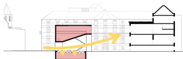
Figuur 2. Doorsnede BG5 (West 8)