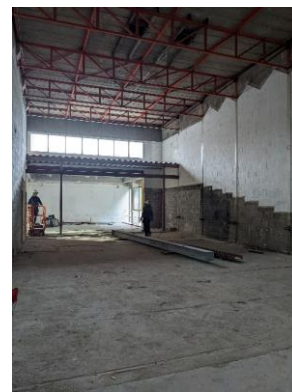
De nieuwe liftschacht, het slopen van de oude liftkern en de lege collegezaal.