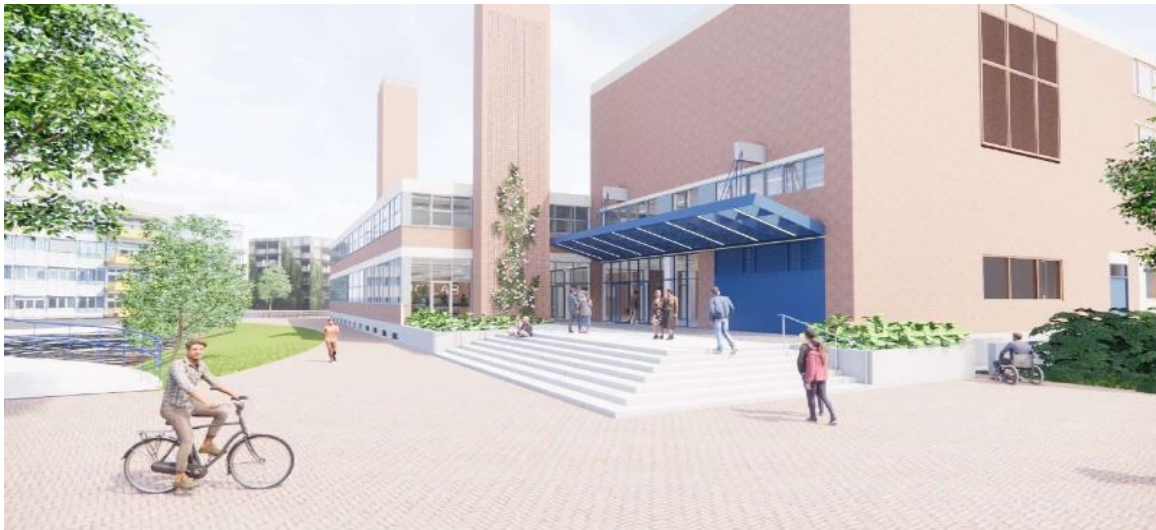
Een impressie van de nieuwe hoofdingang van gebouw JK

De komende maanden gaan wij met 4 projecten aan de slag. Renovatie van gebouw REC P aan de Plantage Muidergracht, groot onderhoud aan gebouw REC J/K en het extra onderwijsgebouw REC V dat op de plot achter CREA wordt gebouwd. In de loop van dit jaar wordt ook gestart met de gevel van gebouw REC BCD met het doel deze gevel waterdicht te maken. Kortom genoeg projecten waar de buurt iets van kan merken. Op onze campuswebsite www.campus.uva.nl publiceren wij een actuele planning van de verschillende bouwactiviteiten. In de toekomst gaan wij de buurtberichten digitaal versturen zodat wij de buurt snel en tijdig kunnen informeren. Wilt u het buurtbericht REC digitaal ontvangen stuur dan een mail met uw verzoek naar Simon de Roo om u aan te melden.