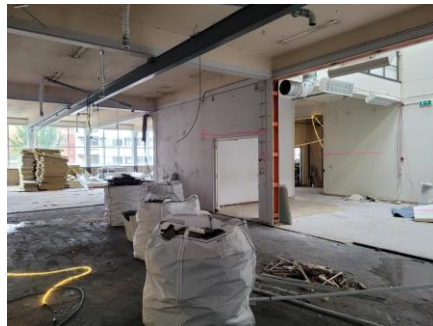
Enkele beelden van de sloopwerkzaamheden in REC JK.