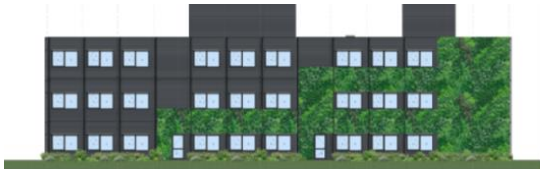
Een impressie van de groene gevel aan de zijde van de Valckenierstraat.

Donderdag 22 september bezochten geïnteresseerde buurtbewoners het nieuw geopende gebouw REC V. Tijdens deze avond namen aanwezigen een kijkje in het gebouw en was er aandacht voor het beoogde ontwerp van de groene gevel van REC V. Het ontwerp voor de groene gevel wordt nu voor finale besluitvorming binnen de UvA voorgelegd. We verwachten deze maand de opdracht aan een leverancier te kunnen verstrekken en dan kan met 4 tot 6 weken de uitvoering starten. In de tussenliggende periode moeten dan de materialen etc. besteld worden. Kortom, zoals het nu lijkt beginnen de werkzaamheden in januari. Zodra er iets meer duidelijkheid is over de planning van de werkzaamheden, ontvangt u meer informatie. Ook de buitenruimte en de groenstrook langs het gebouw worden op korte termijn in definitieve vorm aangelegd. De verwachting is dat de werkzaamheden hiervoor eind december starten.