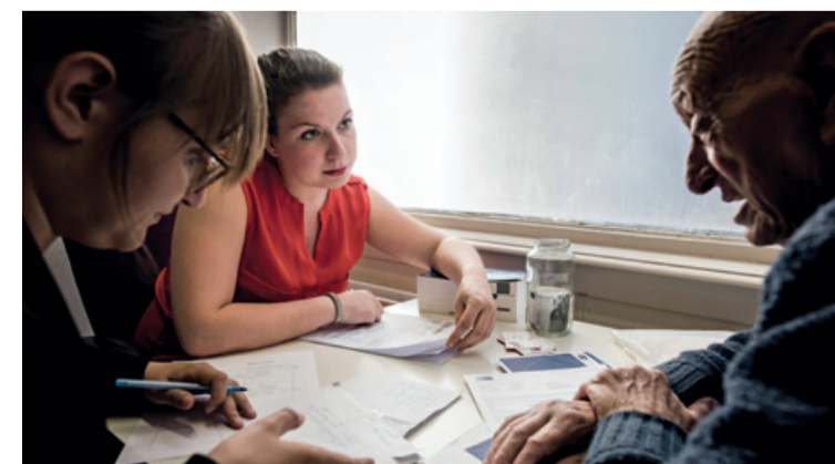
Medewerkers van de Wetwinkel kunnen de meest voorkomende juridische vragen vaak direct beantwoorden.

De Wetwinkel adviseert over consumentenrecht, huur-, arbeids-, en bestuursrecht. Elke dinsdag en donderdag inloopspreekuur van 19.00 - 20.30 uur, Oudemanhuispoort 2-3. Meer informatie over de Wetwinkel op www.wetwinkelamsterdam.nl