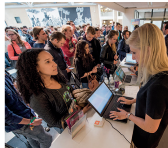
De Sefa balie heeft een centrale plek in de hal van gebouw E; direct aan de belangrijkste looproute naar gebouw B/C.