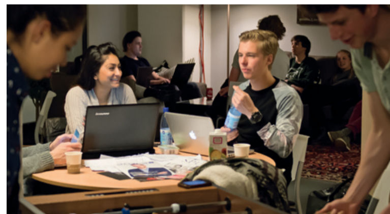
De Common Room vind je op de begane grond in gebouw B/C, naast de collegezalen.

Last voor de (studie)omgeving geeft de Common Room volgens Simon niet. ‘We