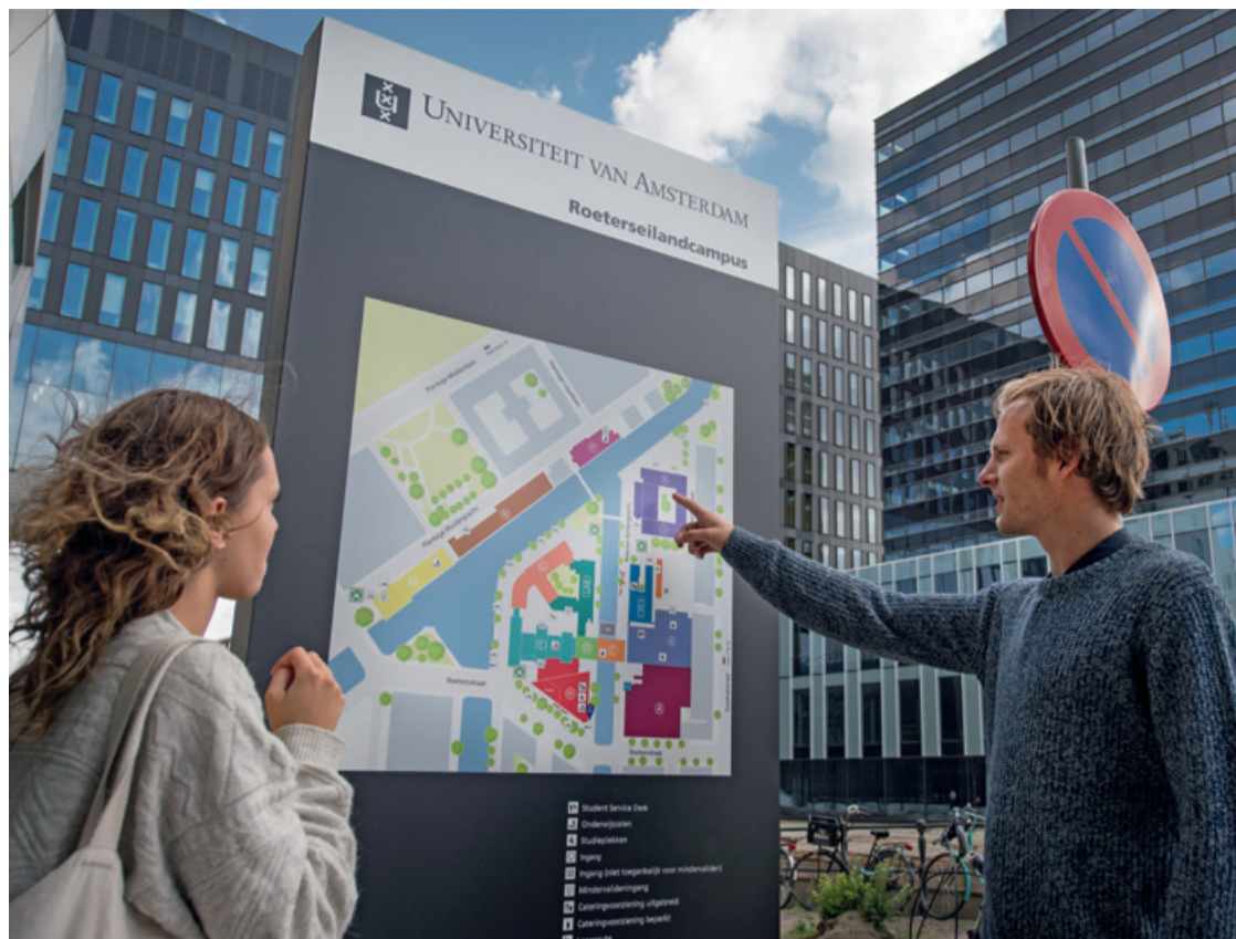
De nieuwe bewegwijzering op en rondom de Roeterseilandcampus, hier aan de Roetersstraat.