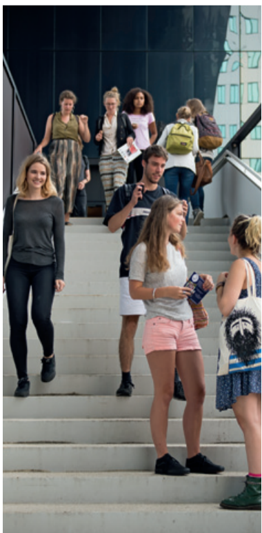
Tijdelijke hoofdingang gebouw B/C.

De ingang aan de Valckenierstraat is sinds dinsdag 1 september alleen nog toegankelijk voor mindervaliden. Alle andere medewerkers en studenten kunnen vanaf die datum gebruikmaken van de hoofdingang van gebouwdeel B/C en de ingang van gebouwdeel D.