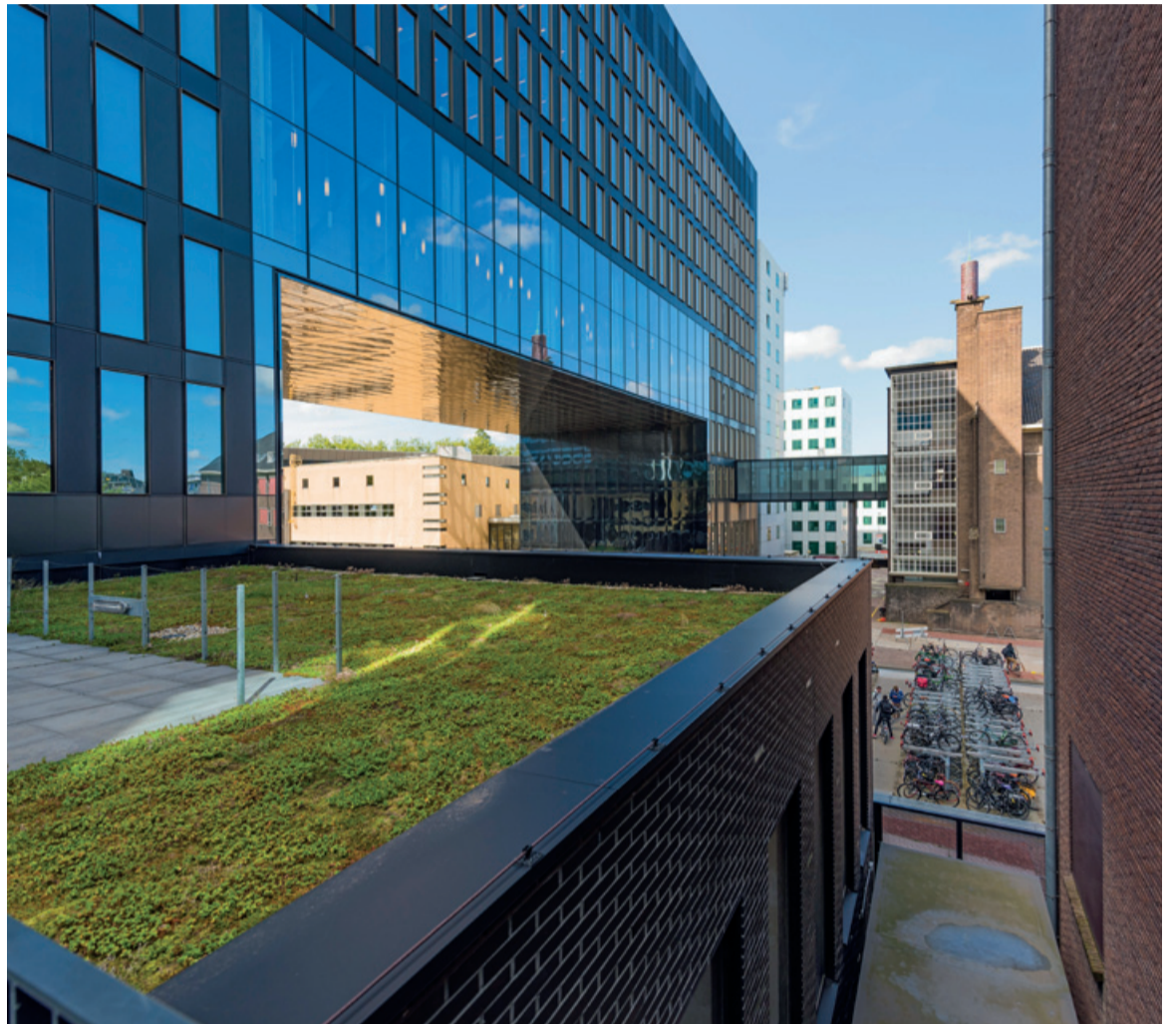
Groene daken; een van de duurzaamheidsmaatregelen van de UvA.

Op het dak van het onderkomen van de Faculteit der Maatschappij- en Gedragwetenschappen ligt een tuin van bijna 3000 vierkante meter. Een voordeel hiervan is dat het riool bij stortbuien niet langer overloopt, want door dit plantendak wordt de waterafvoer naar het riool beperkt. Het groene dak biedt nog meer voordelen.