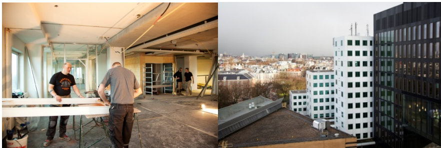
In gebouw E maken we meer open ruimtes. De drie witte torens vormen samen gebouw E.

We vernieuwen de hal en kantoorruimtes in de drie torens van gebouw E. In de grote hal komen de balies voor de Student Service Desk, Room for Discussion, en voor de boekverkoop van studievereniging Sefa.