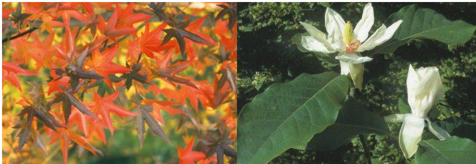
Links: De herfstkleuren van de Amberbomen. Rechts: Een van de rijkbloeiende magnoliasoorten.

We hebben alle bomen langs de kade van de Nieuwe Prinsengracht en op het plein tussen de gebouwen E en G/L gekapt. Voor de herplanting heeft Bureau Inside Outside nieuwe bomensoorten gekozen die goed passen bij de verschillende locaties. De grootste boom in het kleine parkje (de Green Nose) kappen we niet. Op de kade langs de Nieuwe Prinsengracht gaan we Amberbomen planten. Deze bomen krijgen in het najaar een schitterende herfststoot. Langs de noordelijke kade van de Nieuwe Achtergracht komen Hollandse Iepen, allemaal in dezelfde maat als de eerder geplante Iepen voor het Crea-gebouw. Op het plein komen diverse soorten, rijkbloeiende Magnolia's.