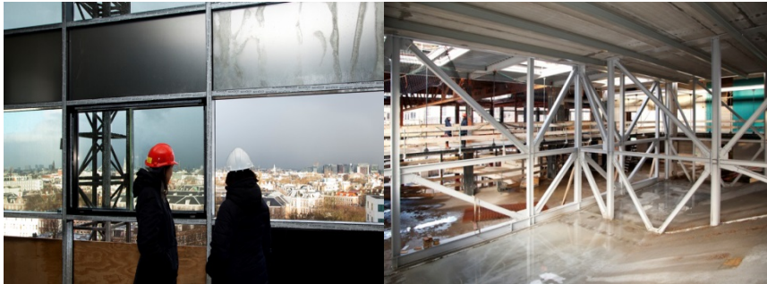
Zicht vanuit de toren van A die nu water- en winddicht wordt gemaakt en collegezalen in aanbouw.