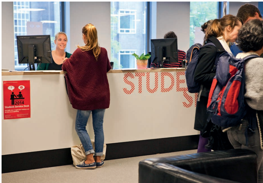
Medewerker Student Service Desk beantwoordt vragen van studenten

Meer weten over duurzaamheid op onze campussen? Kijk op www.campus.uva.nl/duurzaamheid