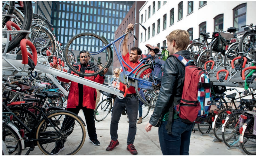
Fietscoaches helpen studenten

Twee weken na de start van het nieuwe collegejaar was al duidelijk dat de grote hoeveelheid – slordig – geparkeerde fietsen overlast in de buurt geeft. Wat doet de UvA eraan?