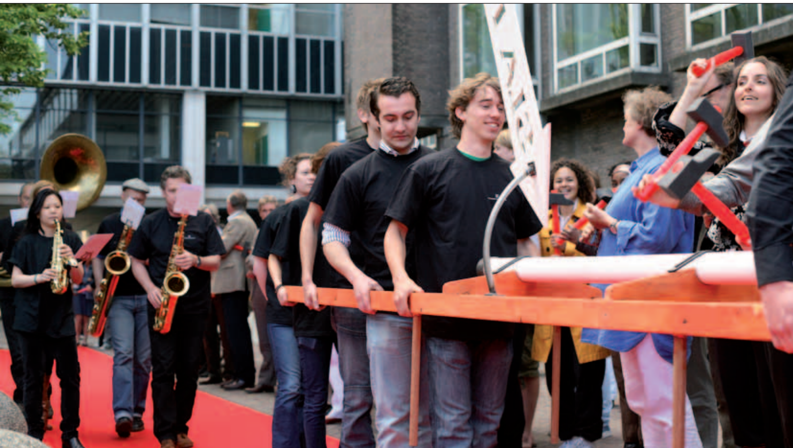
Feestelijke middag tijdens het slaan van de eerste paal.