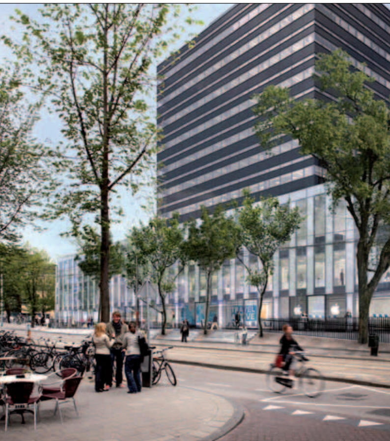
Roeterseiland, gezien vanaf de Roetersstraat. Links: situatie nu (foto: Marcel van Galen). Rechts: situatie straks (Artist Impression: Allford Hall Monaghan Morris)