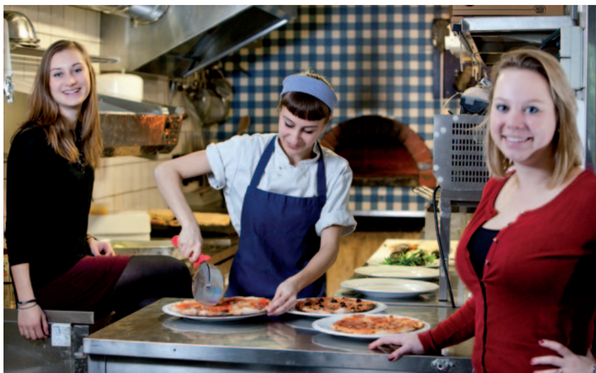
Op bezoek bij deelnemende ondernemer De Pizzabakkers