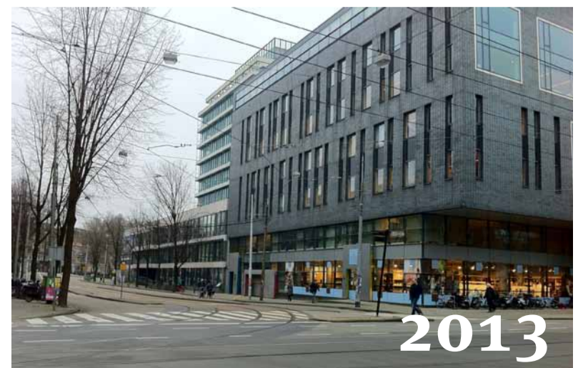
Hoek Sarphatistraat – Roetersstraat

nachtemmers geleidigd in de traag vloeiende goten.' Ook de stank in de stad moet ondraaglijk zijn geweest. Dankzij Sarphati komt daarin verandering. Ook de straat die naar Sarphati is genoemd en die daarvoor Schans heet, verandert dankzij Sarphati in 1870 in een boulevard met, voor die tijd, lichte, luchtige en zonnige woningen. In de Sarphatistraat staat sinds 1814 de Oranje Nassaukazerne, waar nu 180 huurwoningen en kleine bedrijfsjes gevestigd zijn. In een andere oud-kazerne in de Sarphatistraat 470 zit de Rijksacademie van Beeldende Kunsten. Behalve de straat worden ook nog een park, een kade en een verpleeghuis naar Samuel Sarphati vernoemd.