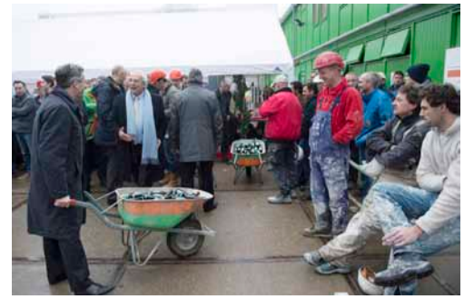
De decanen van de faculteiten rijden het 'pannenbier' naar de bouwvakkers.