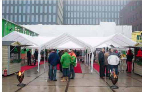
Toch een beetje een witte kerst op de bouwplaats.