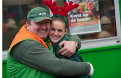
BAM medewerkers in kerststemming.