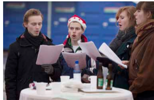
Christmas Carols gezongen door studenten.