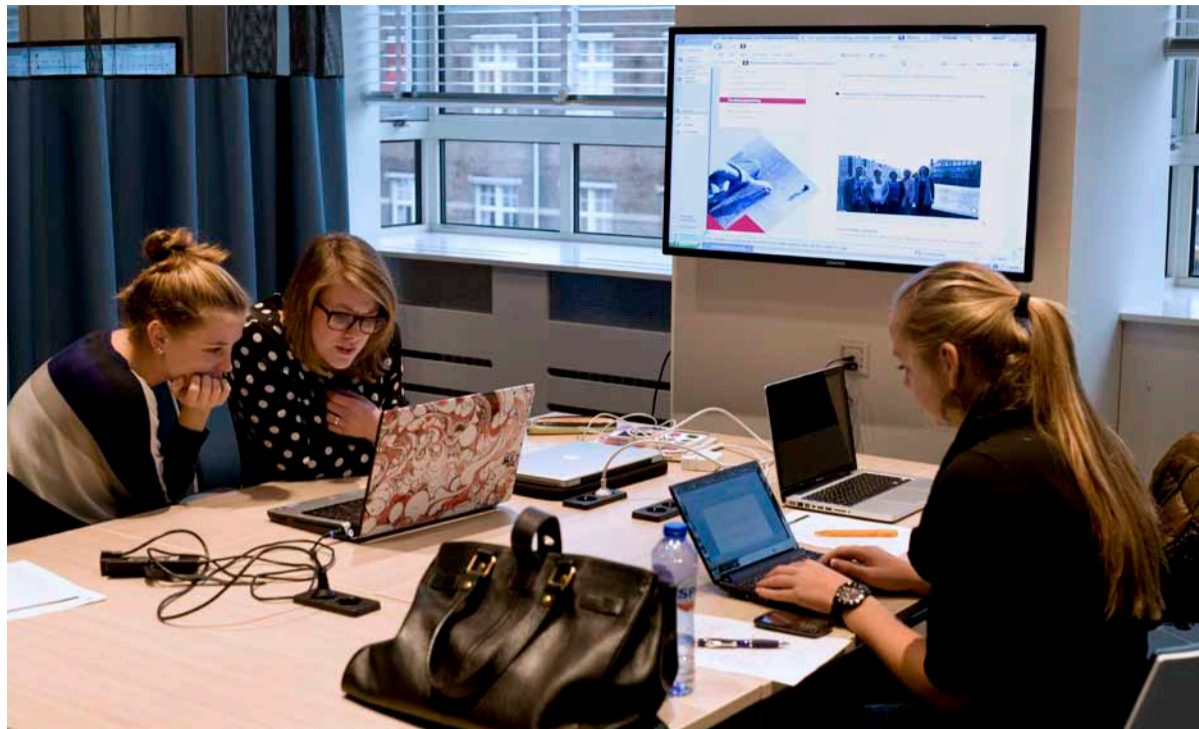
Studenten aan het werk in de onderwijszaal van de toekomst.