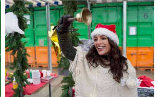
De start van de rondleidingen werd geheel in kerststijl aangekondigd.