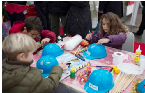
Kindjes versierden hun eigen bouwhelm.