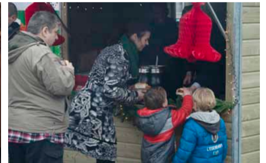
Nog één warme hap dan.