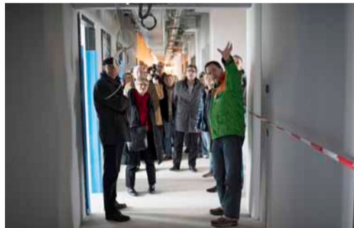
Rondleiding door Gebouw B.