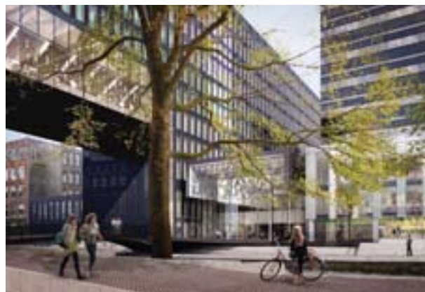
Virtual House. Architect: AHMM

De UvA is in overleg met de aannemer om de renovatie van gebouw A dan ook al in 2012 te starten. Eerder was verwacht in 2013 te beginnen met gebouw A. Als de renovatie eerder van start kan gaan, zou dit kunnen betekenen dat de werkzaamheden op het Roeterseiland een jaar eerder klaar zijn dan verwacht.