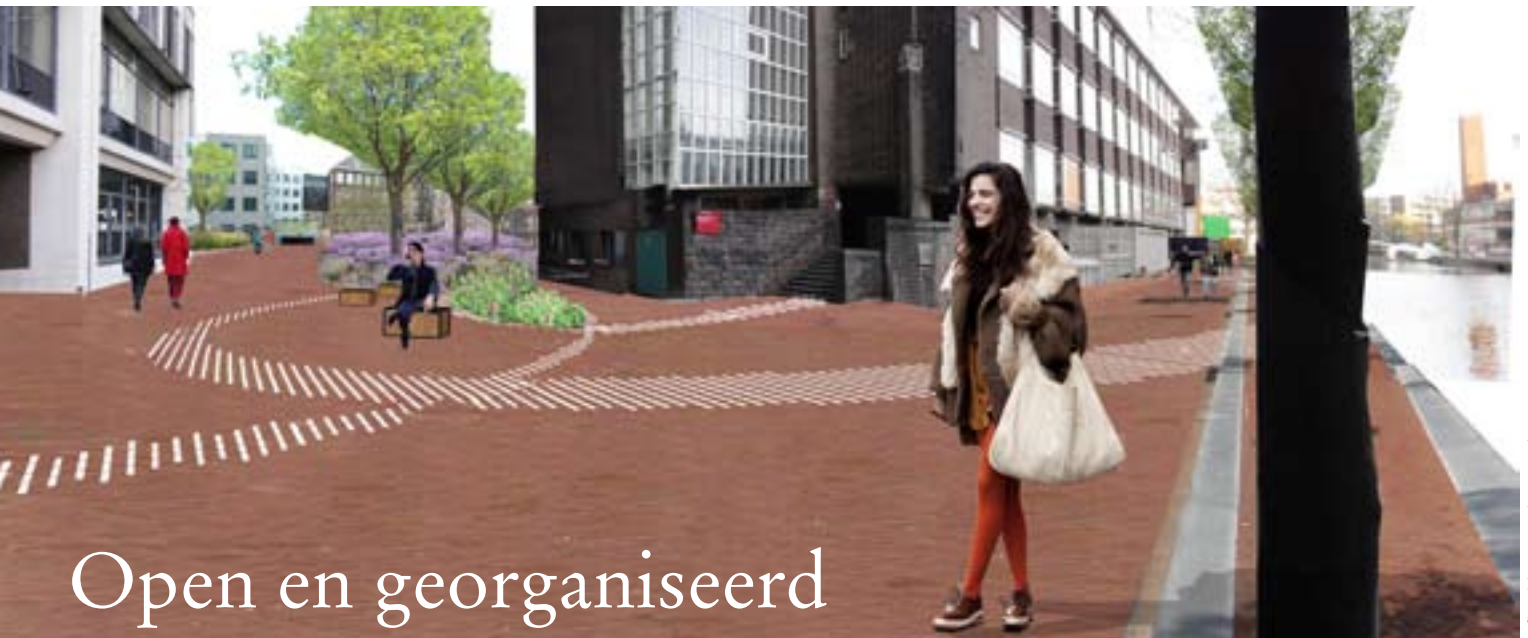
Afbeelding: Inside Outside